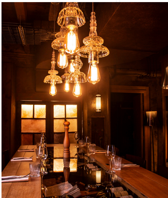
SALLE CAVE À VINS