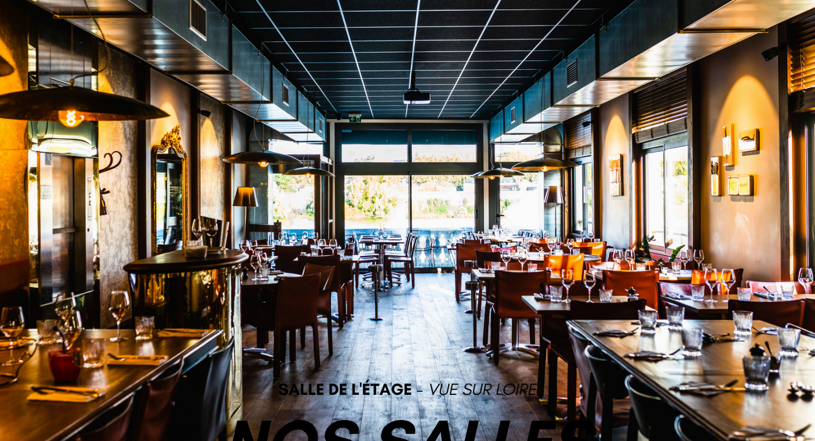
SALLE DE L'ÉTAGE - VUE SUR LOIRE