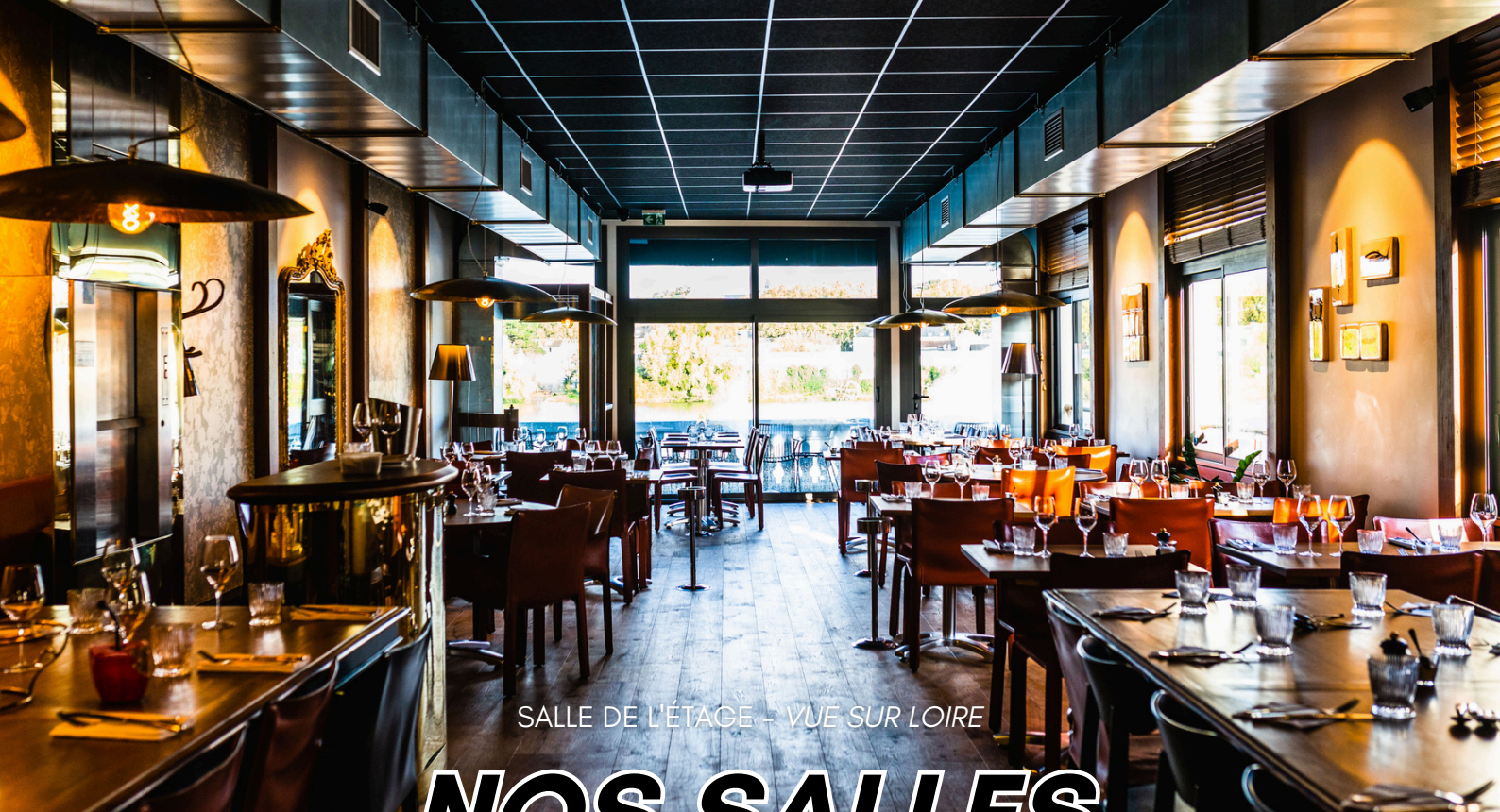
SALLE DE L'ÉTAGE - VUE SUR LOIRE