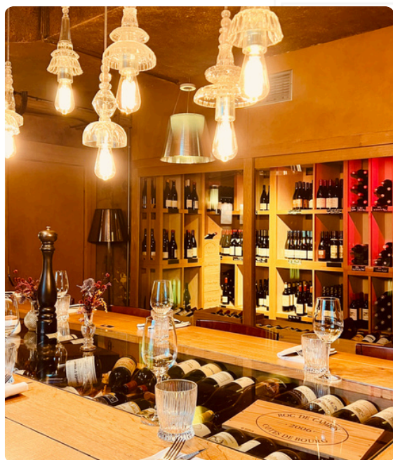
SALLE CAVE À VINS