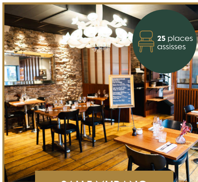
SALLE CAVE À VINS