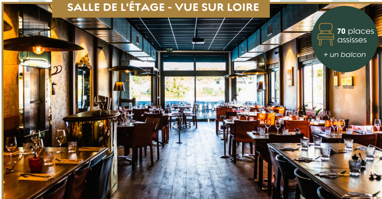
SALLE DE L'ÉTAGE - VUE SUR LOIRE